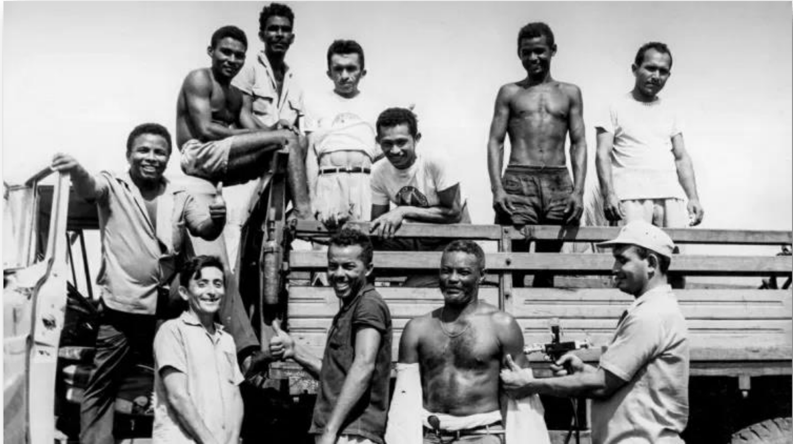
Agentes de endemias vacinando passageiros de caminhão em campanha contra a varíola, na década de 1960