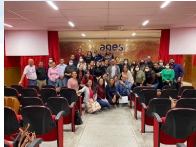
Centro Norte 07/07/2022