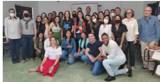
Extremo Sul 21/07/2022