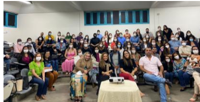
Centro Leste 21/07/2022