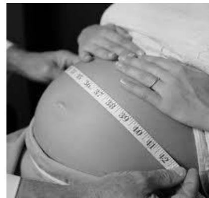
Articulação com os serviços de pré-natal