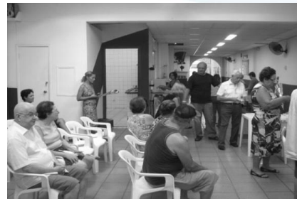
Vacinação em Associação de aposentados