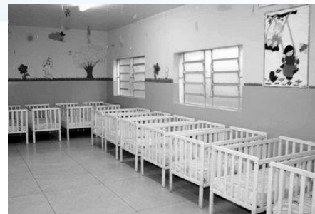
Vacinação em creches