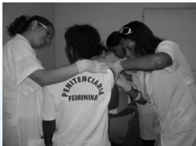
Vacinação em presídios