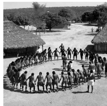
Vacinação nas aldeias