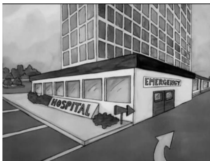
Vacinação em Unidades de Saúde (UBS, ESF, PA'S, Hospitais, etc)