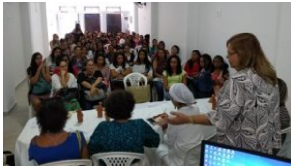
QUALIFICAÇÃO DA REDE CEGONHA NOS MUNICÍPIOS