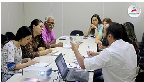
GT DE GLAUCOMA