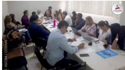
SEMINÁRIO DE ATENÇÃO A GESTAÇÃO E PARTO