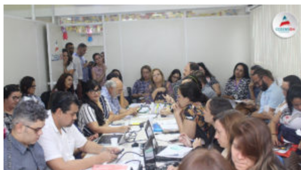
REUNIÃO DO GT HTLV