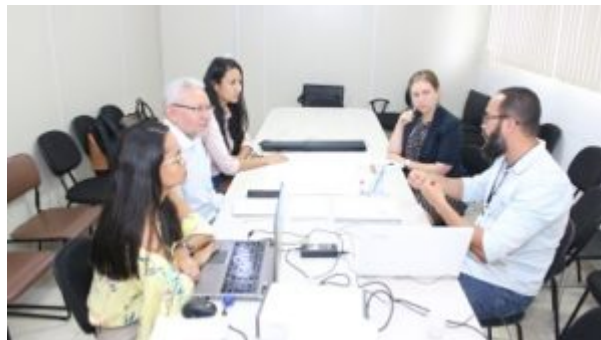
REUNIÃO DO GT DE TRS