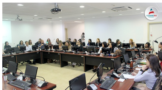
FORUM DE MATERNIDADES DA REDE CEGONHA