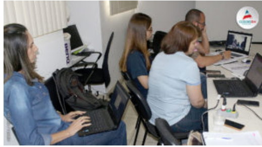
GT DO GLAUCOMA