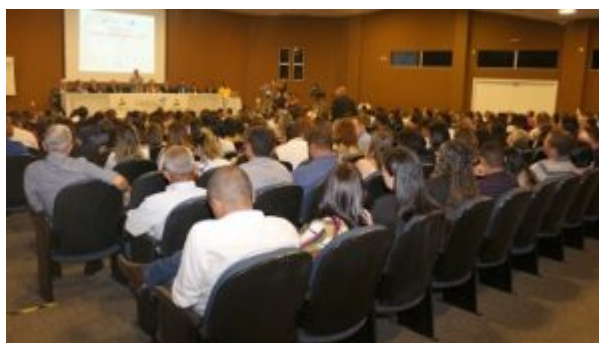
7º ENCONTRO DOS PREFEITOS NA BAHIA