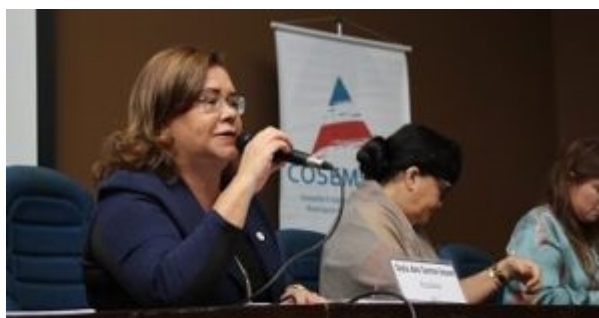
7º CONGRESSO DO COSEMS/BA