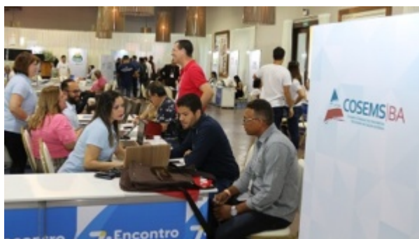
REUNIÃO DA CIT