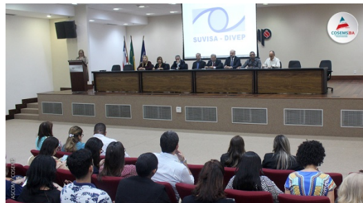
FORUM DE IMUNIZAÇÃO