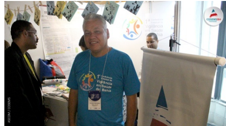
CONFERENCIA DE VIGILÂNCIA A SAÚDE