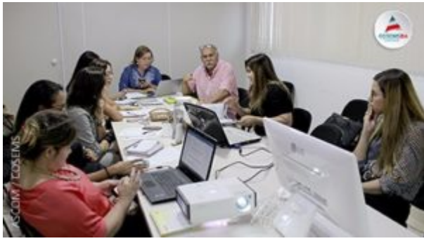
GT CIRURGIAS ELETIVAS