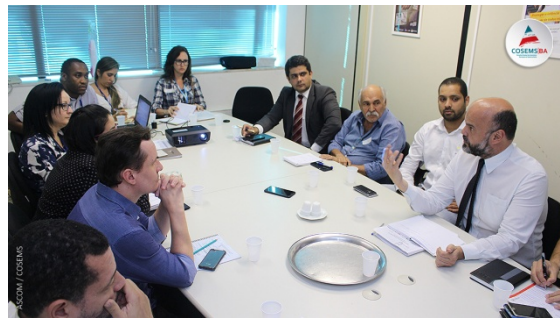
FORUM DE NEUROPEDIATRIA