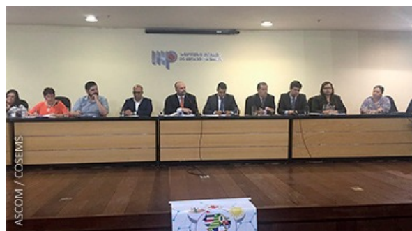
AUDIÊNCIA PÚBLICA DISPENSAÇÃO DE MEDICAMENTOS