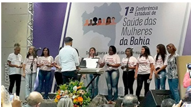
CONFERENCIA DE SAÚDE DAS MULHERES