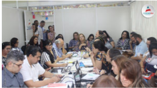
REUNIÃO DO GT HTLV