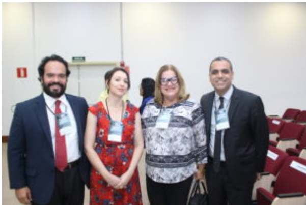
SIMPÓSIO DE SAÚDE MENTAL