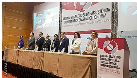
FORUM DA ASSISTENCIA FARMACEUTICA