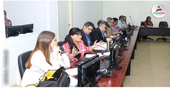
FORUM ESTADUAL DE REGULAÇÃO