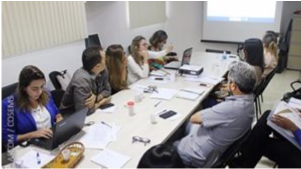
GT DE TERAPIA SUBSTITUTIVA RENAL