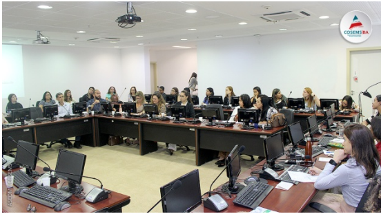
FORUM DE MATERNIDADES DA REDE CEGONHA