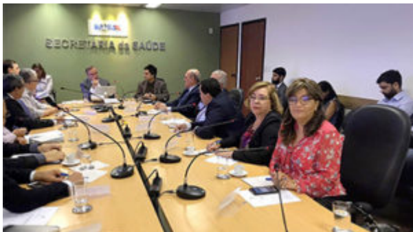
COMITÊ DE PREVENÇÃO DE ACIDENTES DE TRÂNSITO