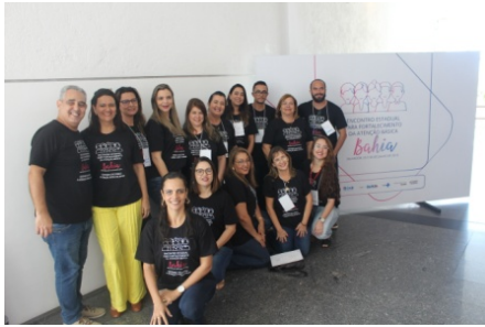
ENCONTRO ESTADUAL DA AB