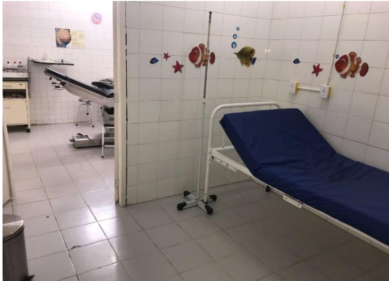
Pré-parto e parto