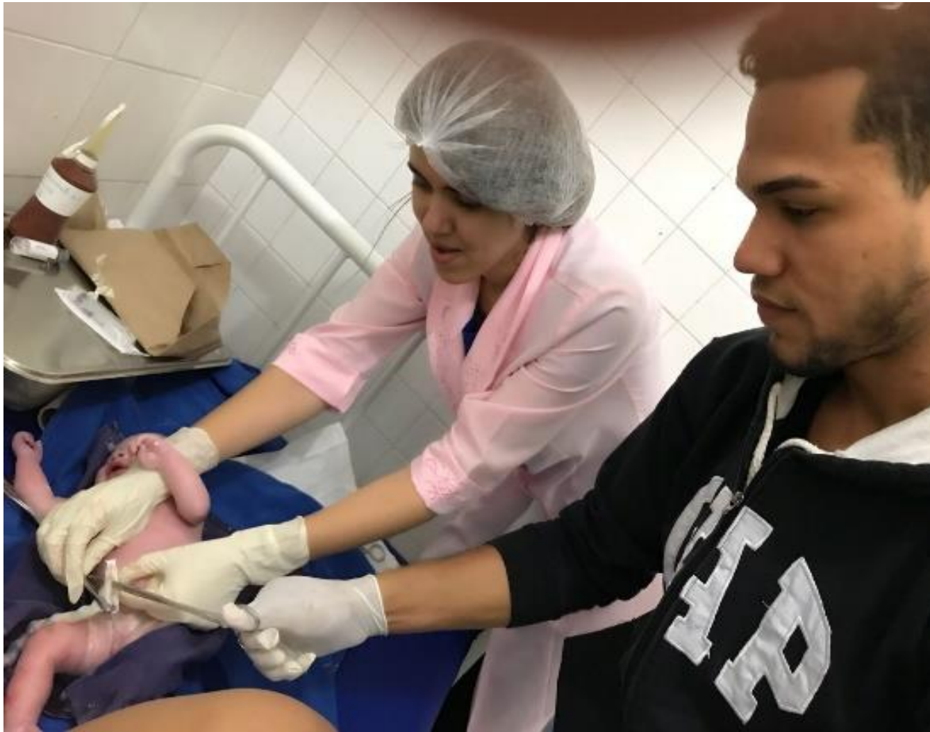
Cordão cortado pelo papai.