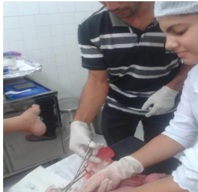
Parto de R.F.S – 12/01/2018, acompanhada pela esposa e sogra!