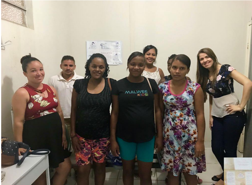
Roda de conversa com as gestantes da ESF da Sede