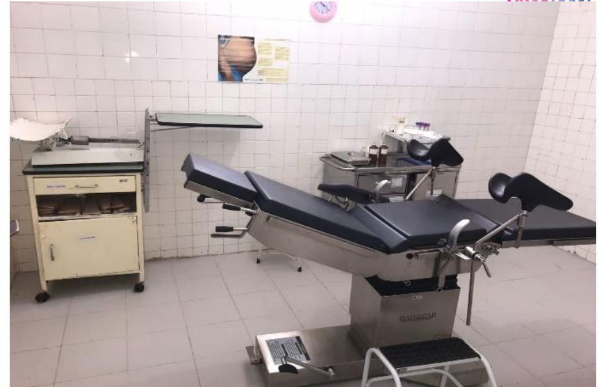
Sala de Parto