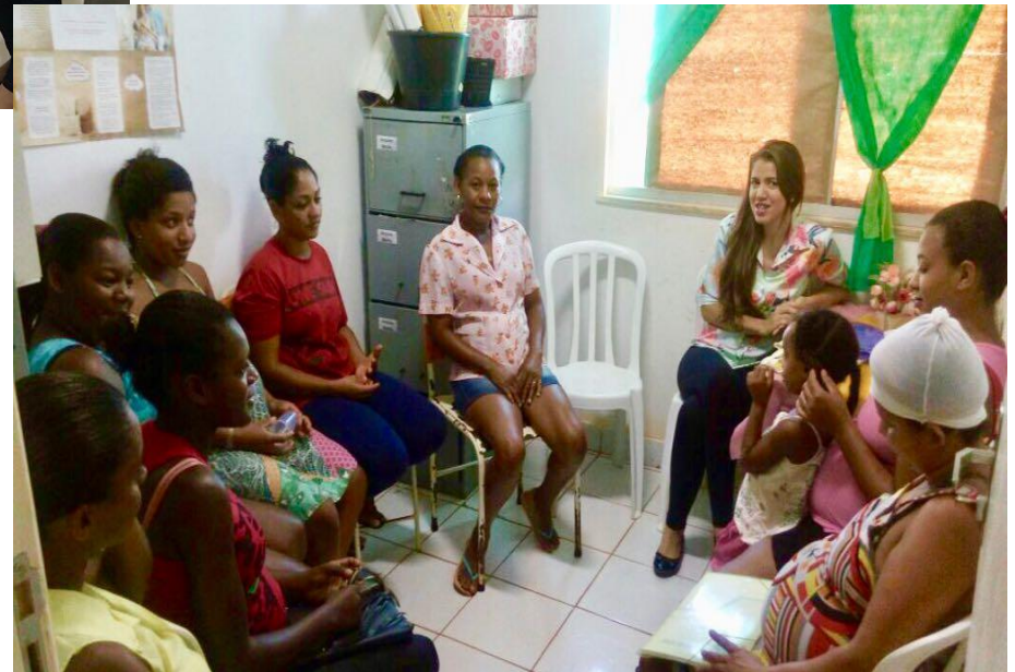
Roda de conversa com as gestantes da ESF do Rosely Nunes